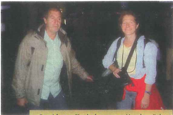
Frankfurter Flughafen: unser Handgepäck

10 und tut nicht Unrecht den Witwen, Waisen, Fremdlingen und Armen, und denke keiner gegen seinen Bruder etwas Arges in seinem Herzen!