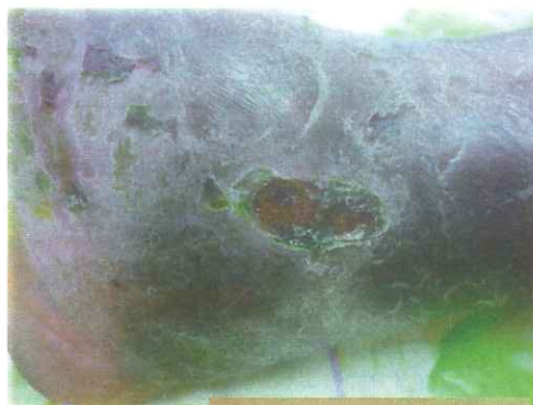
Patient mit Cromomycose