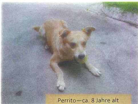
Perrito—ca. 8 Jahre alt

Die Gemeinde platzt aus allen Nähten - im Hauptgottesdienst am Sonntagmorgen gibt es noch nicht einmal genügend Stehplätze - draußen vor der Eingangstür hören auch noch einige zu.