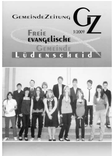
Die letzte GZ im alten Gewand

„Neues aus dem Gemeindehaus“ ist eine Rubrik, die sicherlich schon lange überfällig war. Es ist wichtig, dass wir über aktuelle bauliche Probleme